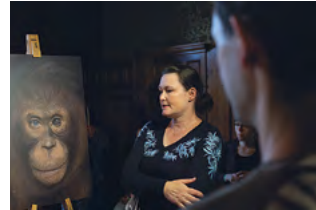
Infostand und Vortrag zur Langen Nacht der Museen in der Villa Patumbah.