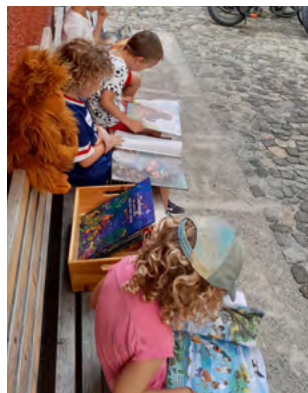
Bild links: Eintauchen in die Orang-Utan-Welt via BOS-Bücherkiste. Bilder Mitte und rechts: Palmöl in Produkten vermeiden, geht das?

Nachhaltige Geldanlage: Negativzinsen sind für gemeinnützige Organisationen besonders gemein, denn wir wollen unsere wertvollen Spendengelder lieber in unsere Projekte investieren. Um Negativzinsen zu vermeiden, haben wir auf eine besonders nachhaltige Geldanlage bei der Alternativen Bank Schweiz umgestellt. Dort soll ein Teil unseres Vereinsvermögens mit einer wenig riskanten und mittelfristigen Anlagestrategie kleinere Gewinne für unsere Bildungsarbeit erwirtschaften.