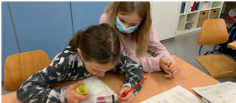
Schülerinnen der Primarschule Bonstetten testen ihr Orang-Utan-Wissen mit unseren Arbeitsblättern.

MÄRZ BOS macht Schule: Wir brachten Orang-Utan-Wissen ins Klassenzimmer. BOS Schweiz öffnete Schüler*innen in Bonstetten stufengerecht die Augen für die dramatische Situation der Orang-Utans und ihres Lebensraumes.