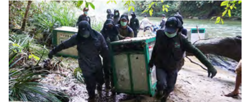
Ben hat es als 500. BOS-Orang-Utan endlich zurück in die Freiheit geschafft.