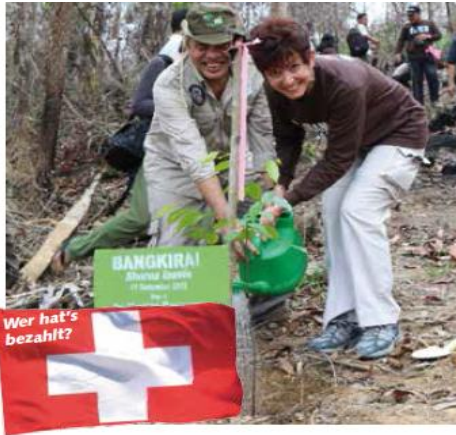
◀ Die Schweizer Botschafterin pflanzt einen Baum.